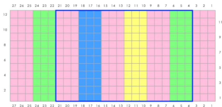
Diagramme Rectangles du Corps