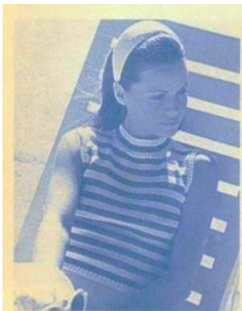
Modèle n° 95. ELG 26