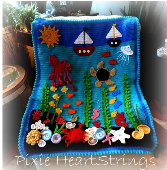
Milieu marin parfait pour les vacances, photo dans le PDF.