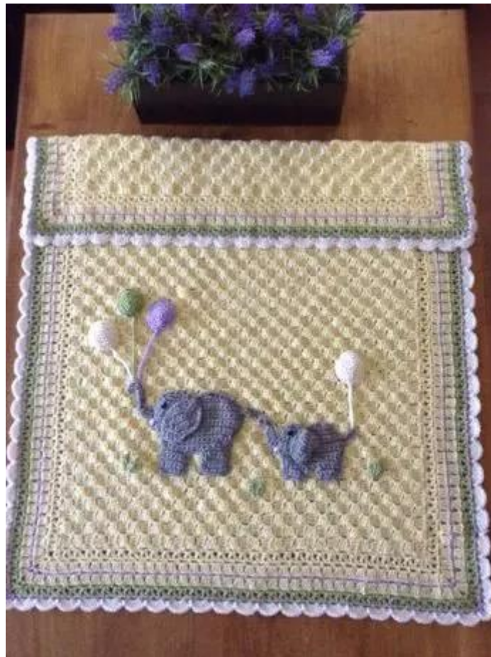
C'est la ronde des éléphants avec maman et bébé, j'adore !