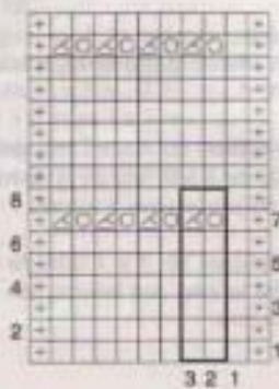
Diagramme jersey envers ajouré

On l'utilise essentiellement pour réaliser des jours.