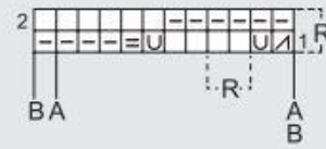
GRÁFICO D / GRAPHIQUE D / GRAPH D / GRAFIEK D / STRICKSCHRIFT D / GRAFICO D

R Repetir / Répéter / Repeat / Herhalen / Wiederholen / Ripetere