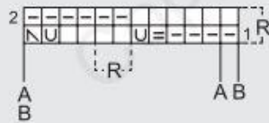
GRÁFICO C / GRAPHIQUE C / GRAPH C / GRAFIEK C / STRICKSCHRIFT C / GRAFICO C

R Repetir / Répéter / Repeat / Herhalen / Wiederholen / Ripetere