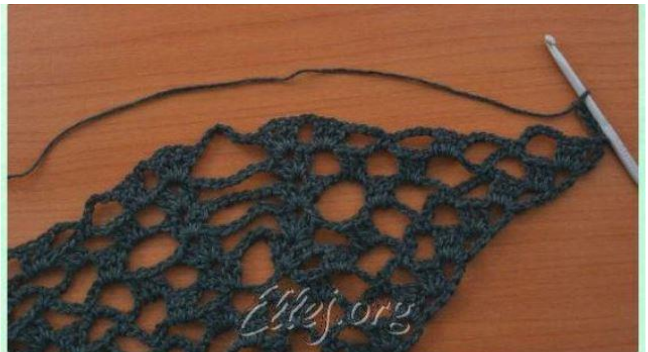
une petite photo du 6e rang

comme je vous le disais, c'est très simple, mais il fallait y penser !